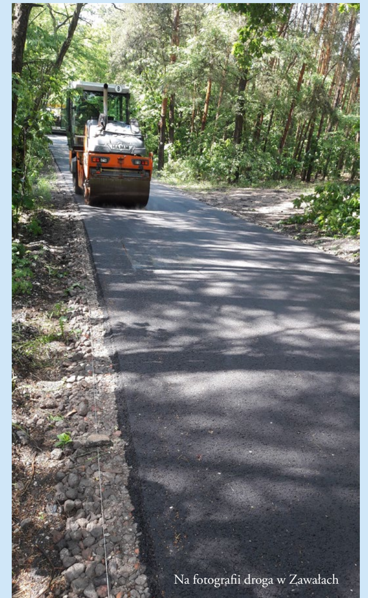
Na fotografii droga w Zawałach

W maju 2017 r. oddano do użytkowania oświetlenie uliczne w Brzozówce na ul. Szkolnej. Zamontowano 10 słupów i 11 nowych opraw LED (60W). Łączny koszt inwestycji wraz z dokumentacją wyniósł 75.000,00 zł brutto.