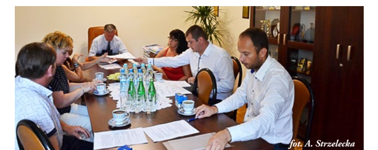
fol. A. Strzelecka