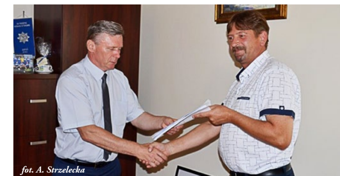
fol. A. Strzelecka