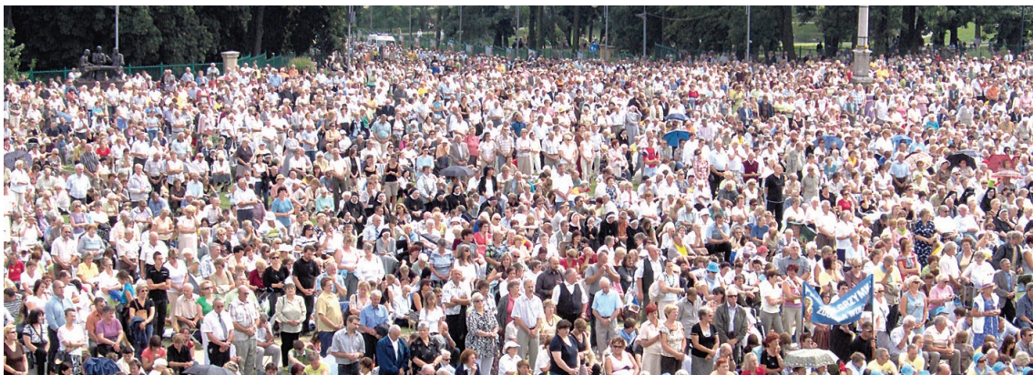
Pielgrzymi z całej Polski modlili się do Najświętszej Paniienki Jasnogórskiej. Byli wśród nich również samorządowcy z Obrowa

Najświętsza Maryja Panna w swej Jasnogórskiej Ikonie była, jest i będzie dla polskiego narodu najlepszą pośredniczką w dążeniu do spełniania Woli Bożej, na którą duży wpływ mają właśnie samorządowcy współpracujący z każdym człowiekiem.