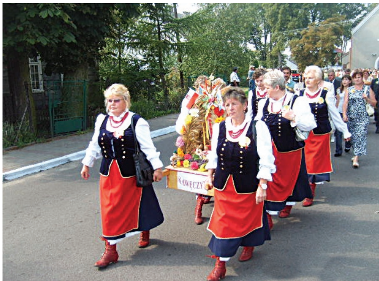
Przemarsz korowodu dożynkowego prowadził od kościoła na boisko szkolne