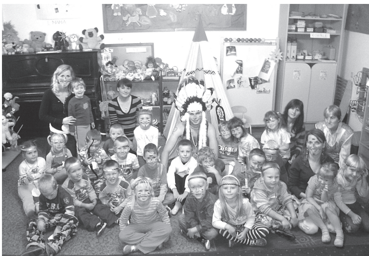
W Małym Przedszkolu w Skrzypkowie i Obrowie wszystkie dzieci czują się wysmieniec